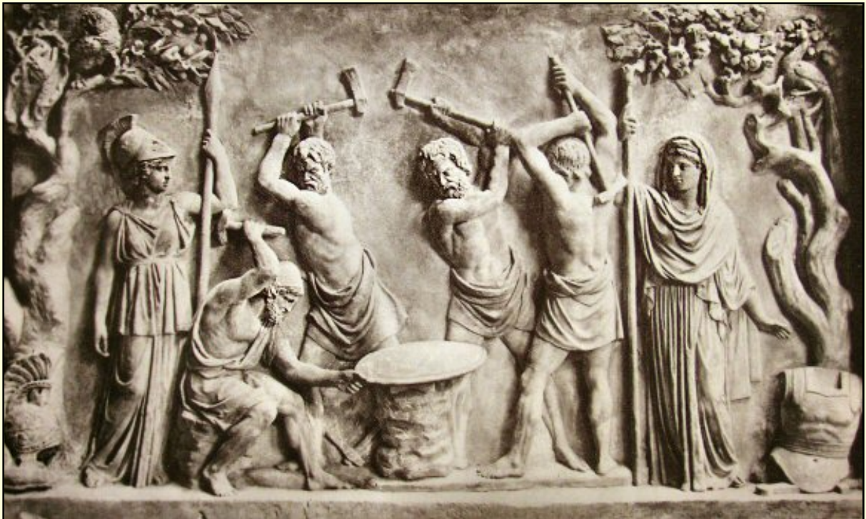
Héphaïstos et les Cyclopes forgeant le bouclier d'Achille, bas-relief antique.

Le travail philosophique externe comme discipline philosophique